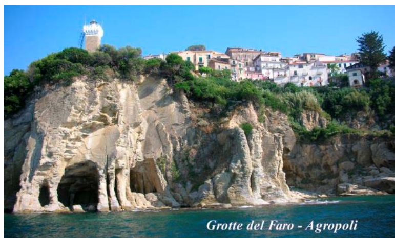
Grotte del Faro - Agropoli

Agropoli - Acciaroli - Pioppi - Borgo di Castellabate - Grotte di Pertosa Certosa di Padula - Velia - Castelnuovo Cilento - Palinuro - Camerota - Paestum dal 19 al 24 Aprile