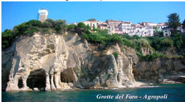
Grotte del Faro - Agropoli

Al termine, Proseguimento per l'Hotel, sistemazione nelle camere riservate, cena e pernottamento.